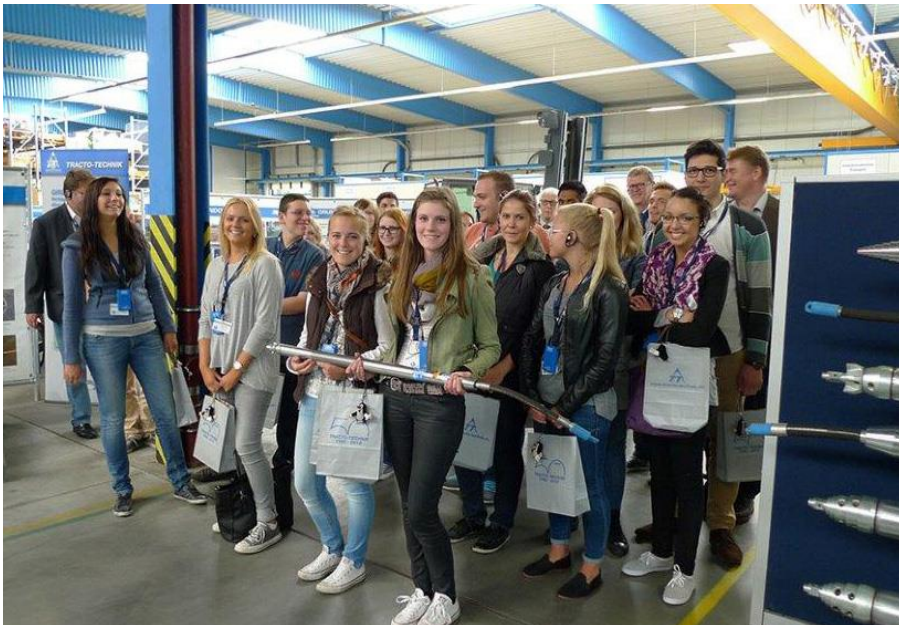
Besichtigung der Tracto Technik GmbH & Co. KG in Lennestadt durch den Arbeitskreis im Herbstsemester 2014