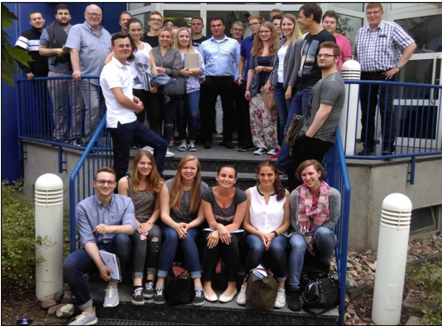
Besichtigung der INMET Stahl GmbH & Co. KG in Bochum durch den Arbeitskreis im Frühjahrssemester 2016