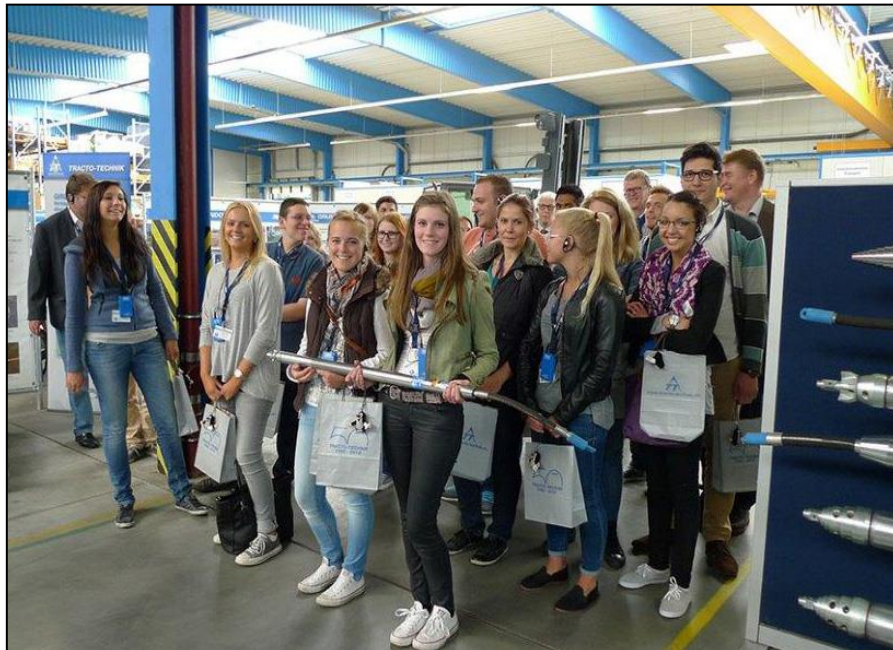
Besichtigung der Tracto-Technik GmbH & Co. KG in Lennestadt durch den Arbeitskreis im Frühjahrssemester 2014