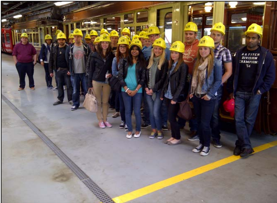
Besichtigung der Wuppertaler Schwebebahn durch den Arbeitskreis im Frühjahrssemester 2013