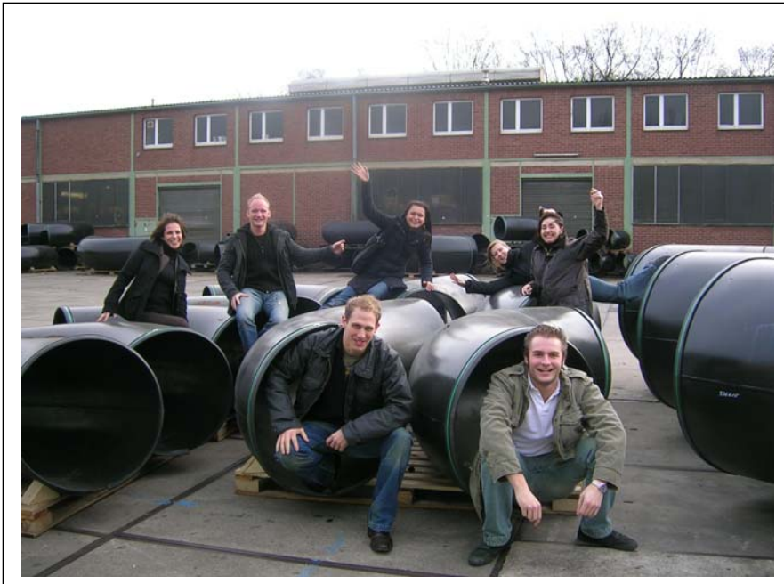
Besichtigung der Wilhelm Geldbach Industrie GmbH in Gelsenkirchen im Dezember 2006