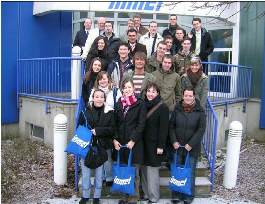
Besichtigung Inmet Stahl GmbH & Co. in Bochum 2005