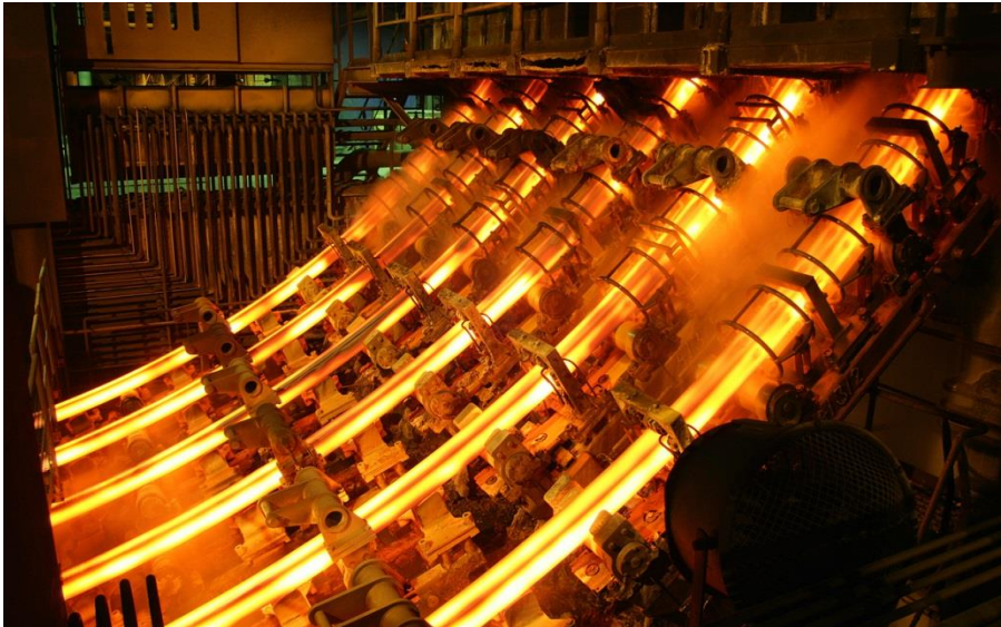
Stranggießanlage für Knüppel