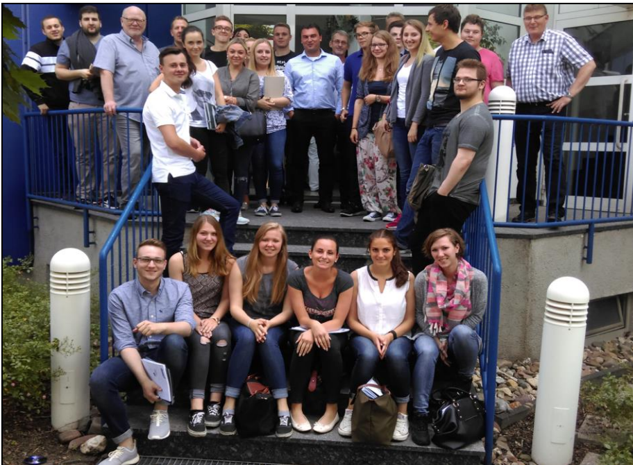
Besichtigung der INMET Stahl GmbH & Co. KG in Bochum durch den Arbeitskreis im Frühjahrssemester 2016