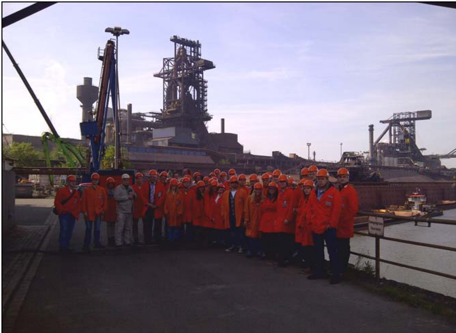
Besichtigung der HKM Hüttenwerke in Duisburg-Huckingen durch den Arbeitskreis im Frühjahrssemester 2012