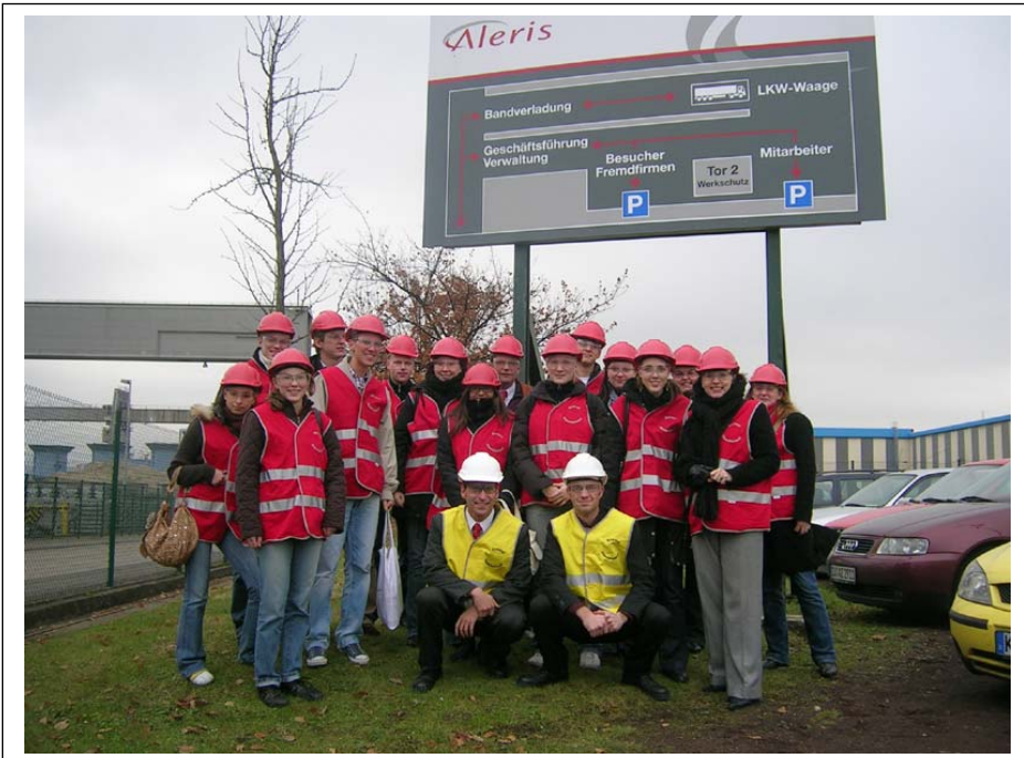
Besichtigung der Aleris Aluminium Koblenz GmbH durch den Arbeitskreis im Herbstsemester 2007