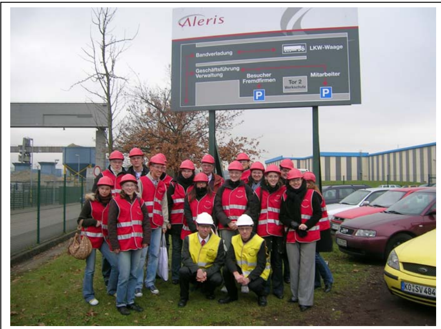
Besichtigung von Aleris in Koblenz